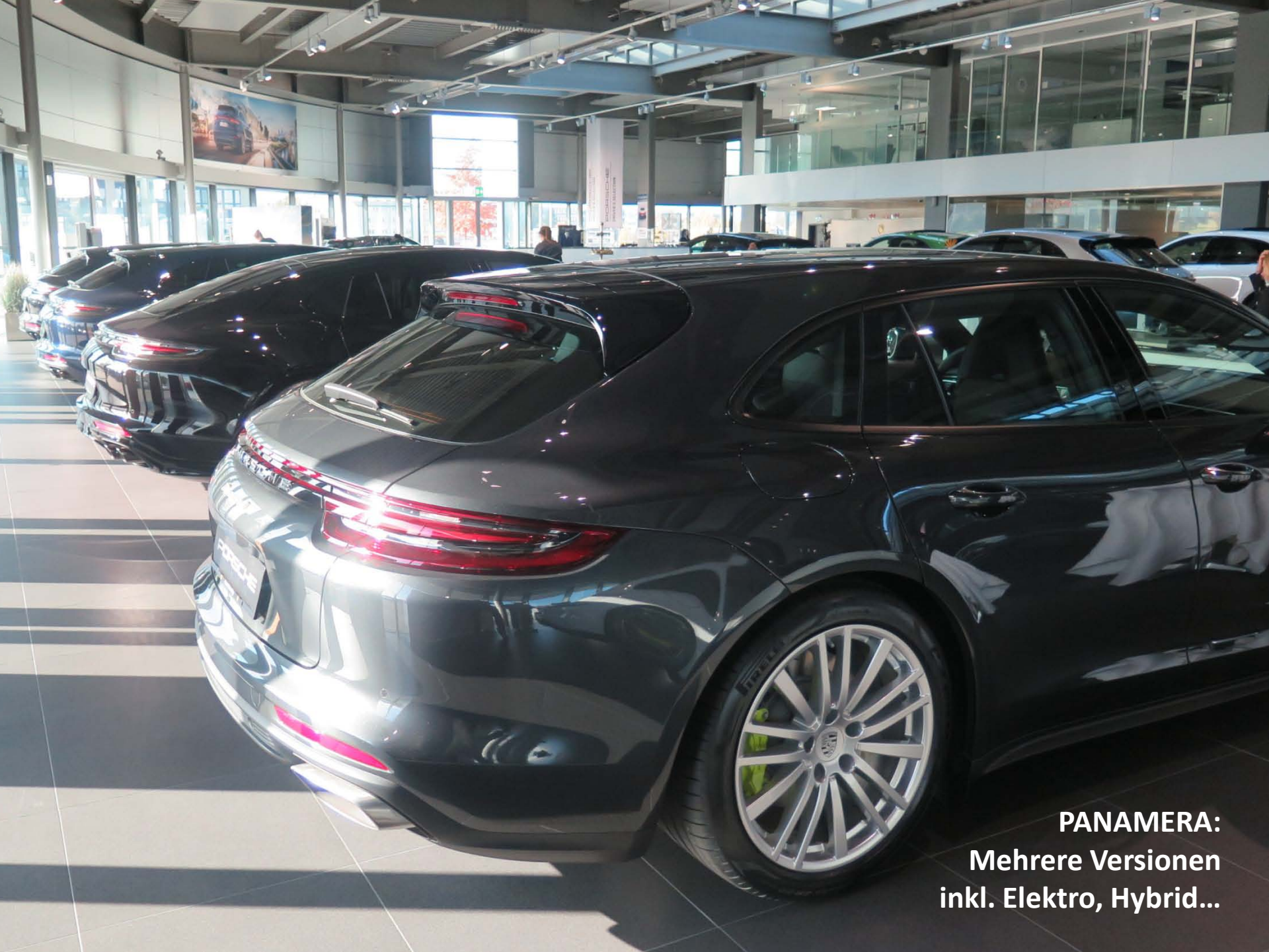
PANAMERA: Mehrere Versionen inkl. Elektro, Hybrid...